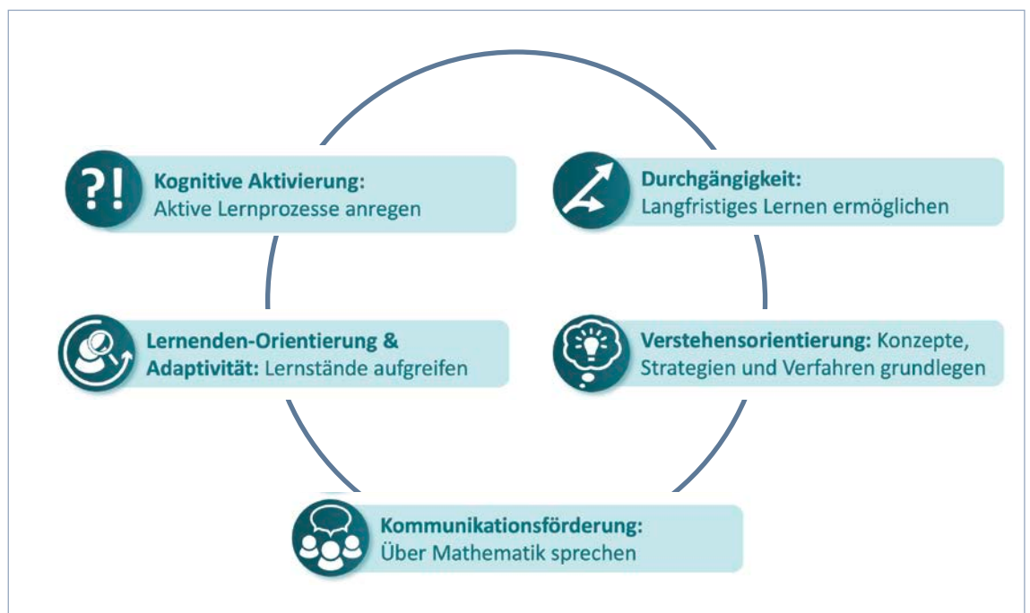
Abb. 1: Fünf Prinzipien für qualitätsvollen Mathematikunterricht

Wir haben daher die mathematikdidaktische und bildungswissenschaftliche Forschungsliteratur ausführlich gesichtet, verschiedene Modelle übereinandergelegt und immer wieder mit erfahrenen Lehrkräften, Aus- und Fortbildenden diskutiert, welche Qualitätsmerkmale als die wichtigsten erachtet werden können. Ausgewählt haben wir fünf Prinzipien