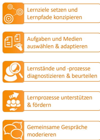
Abb. 2: Fünf Jobs (= didaktische Anforderungs- situationen) der qualitätsvollen Unterrichts- planung

(s. Abb. 1 ), die zahlreiche wichtige Qualitätsmerkmale enthalten und mit denen man in vielen unterrichtlichen Anforderungssituationen gute didaktische Entscheidungen treffen kann (Prediger u. a. 2022). Diese werden wir nachfolgend kurz skizzieren (Überblick und Ausdifferenzierungen s. Tab. 1 ).